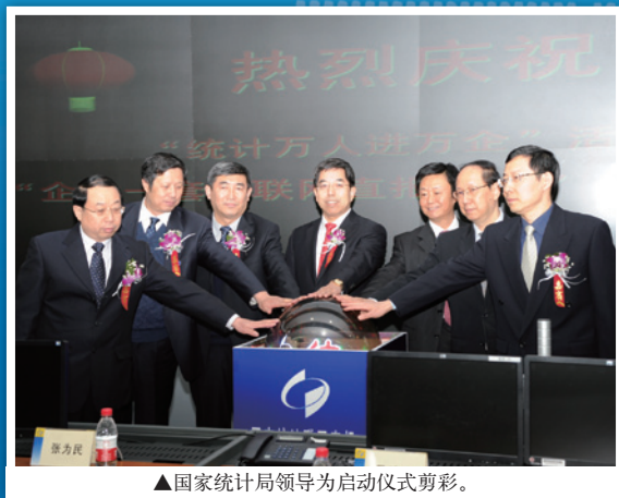
▲国家统计局领导为启动仪式剪彩。

建设四大工程是提高政府统计公信力的保障。通过建设四大工程，可以确保统计制度方法的统一，实现各级统计机构、各专业共享原始数据，消除统计数据之间不匹配的现象。四大工程的实施，可以使统计工作更加规范，业务流程更加完善，调查制度更加科学，为公开统计数据生产过程，提高统计工作透明度，做好解疑释惑工作奠定坚实基础。